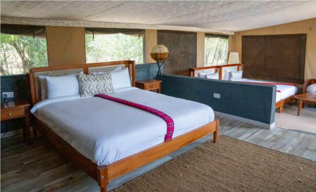
Das große Schlafzimmer im Chalet