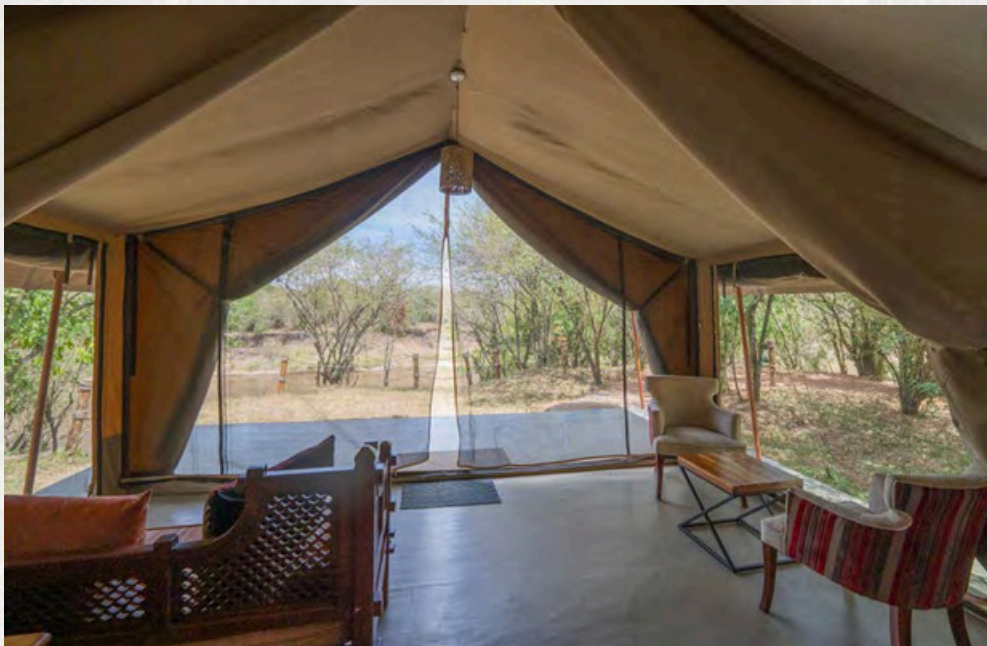
Große Vorräume in allen Zelten mit Sofa, Sesseln und Tisch

Die Camp-Inhaber Deepa und Jaspal sind selbst begeisterte und erfahrene Amateur Fotografen – dies merkt man sofort an den Zeltausstattungen. Alle Zelte verfügen über große Vorräume mit Sofa, Sesseln und Tisch um sich selbst und natürlich das ganze Fotogedöns niederzulassen. Dazu sind Schreibtische mit 24/7 Stromversorgung zum Laden der Akkus und für ein bequemes Arbeiten beim Sortieren der vielen Fotos in allen Zelten Standard. Hygienische, gemauerte Waschräume mit Doppelwaschbecken und getrennten Duschen und WC's in allen Doppel- und Twinbettzelten gewähren auch Fotografen, die sich ein Zelt teilen, ein hohes Maß an Intimität.