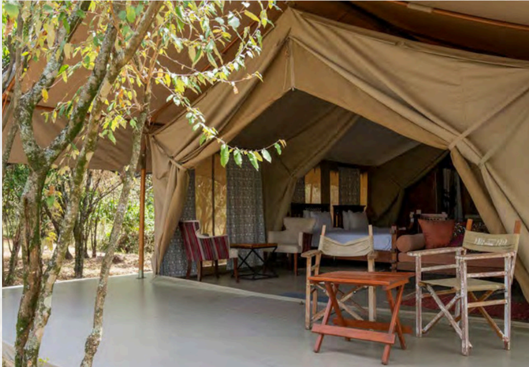
Die Zelt-Terrassen mit direktem Blick zum Mara River

Die Doppel- und Twinbett Zelte liegen alle direkt am Mara Flussufer. Tierbeobachtungen und Fotos können direkt von der Zelt-Terrasse gemacht werden. Häufig sind Hippos, Krokodile, Antilopen und viele Vogelarten.