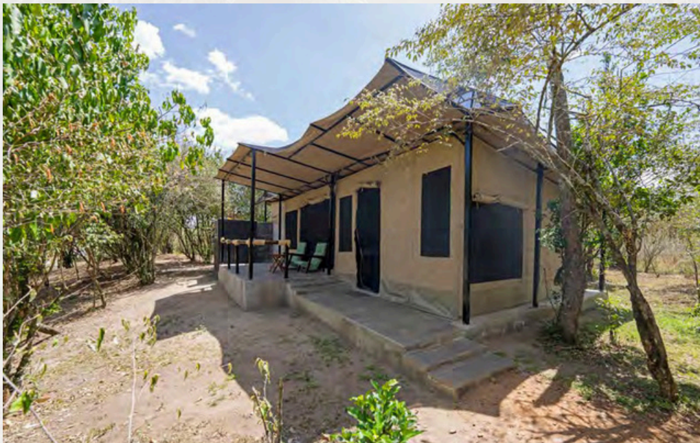
Eins der luxuriösen Chalet-Zelte