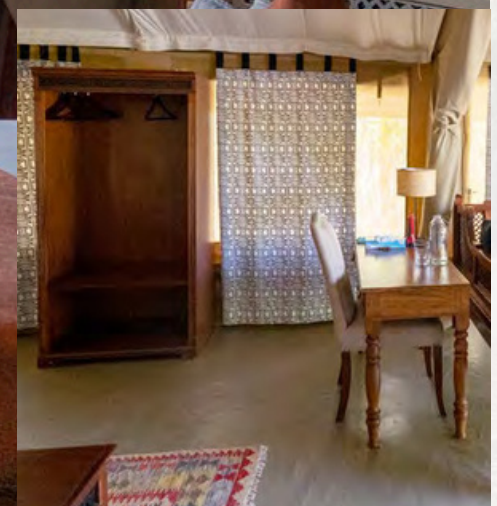
Kleiderregal und Schreibtisch