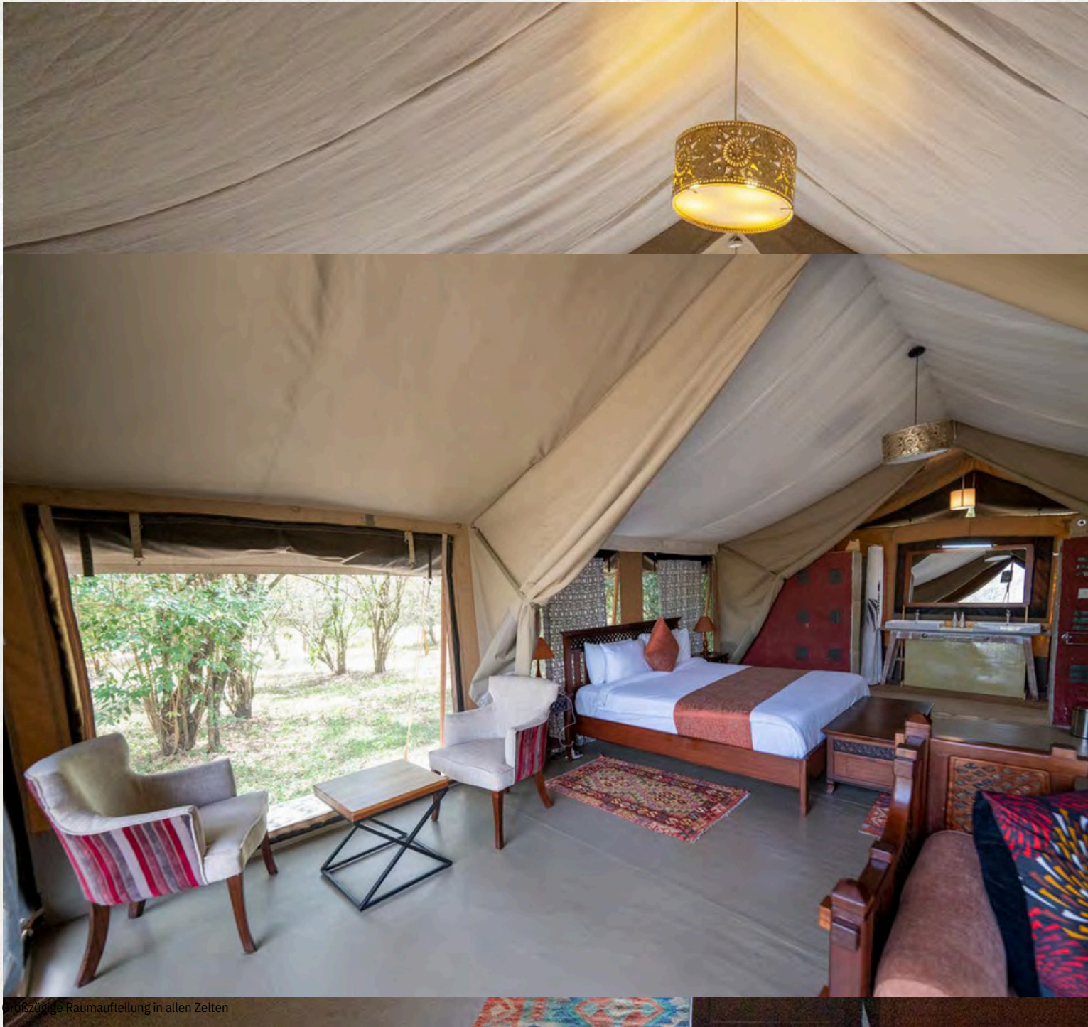
flexible Raumaufteilung in allen Zelten