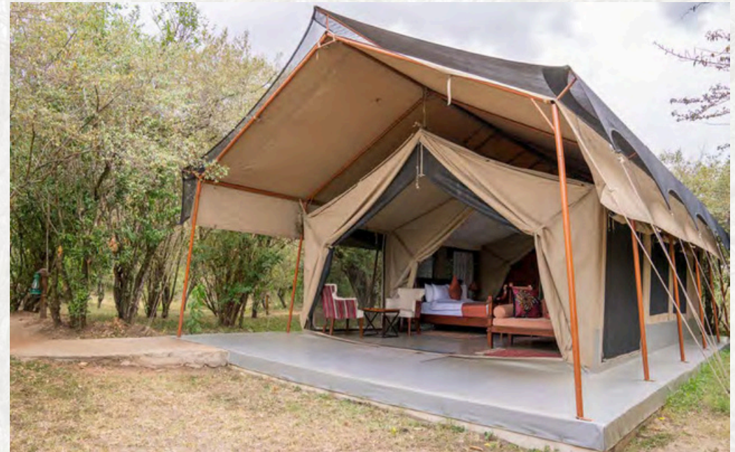
Doppel- und Twinbed-Zelt