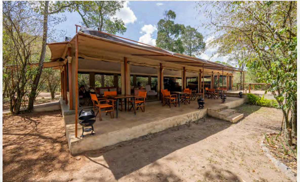
Die überdachte Terrasse des Lounge-Zelts gewährt einen Blick auf den Mara River mit Hippopool. Im Hintergrund links ist der Zugang zum nahegelegenen Parkplatz zu erkennen.

Das Olive Bushcamp ist ebenerdig angelegt und vom Parkplatz zur Lounge oder zu den Waschräumen sind es nur sehr kurze Wegstrecken. Auch die meisten Zelte sind nicht weit entfernt und es stehen genügend Helfer zur Verfügung, um beim Foto-gepäck behilflich zu sein. Dadurch ist das Olive Bushcamp auch hervorragend für ältere oder auch für gehbehinderte Fotografen und Filmer geeignet.