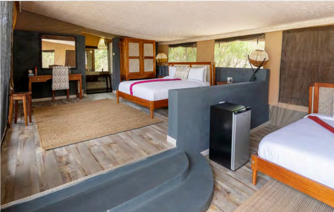
Chalet-Zelte laufen über zwei Ebenen