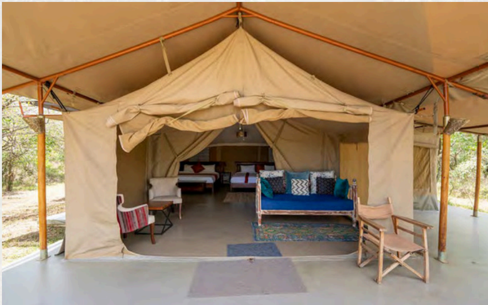
Familienzelt-Zelt mit erweitertem Schlafraum

Das Familienzelt im Olive Bushcamp hat die gleiche Grundausstattung wie alle Doppel- und Twinbed-Zelte, nur der hintere Schlafraum ist deutlich erweitert und mit einem großen Doppelbett und zwei komfortablen Einzelbetten ausgestattet. Das Zelt kann von bis zu 4 Personen genutzt werden. Preis und Verfügbarkeit auf Anfrage.