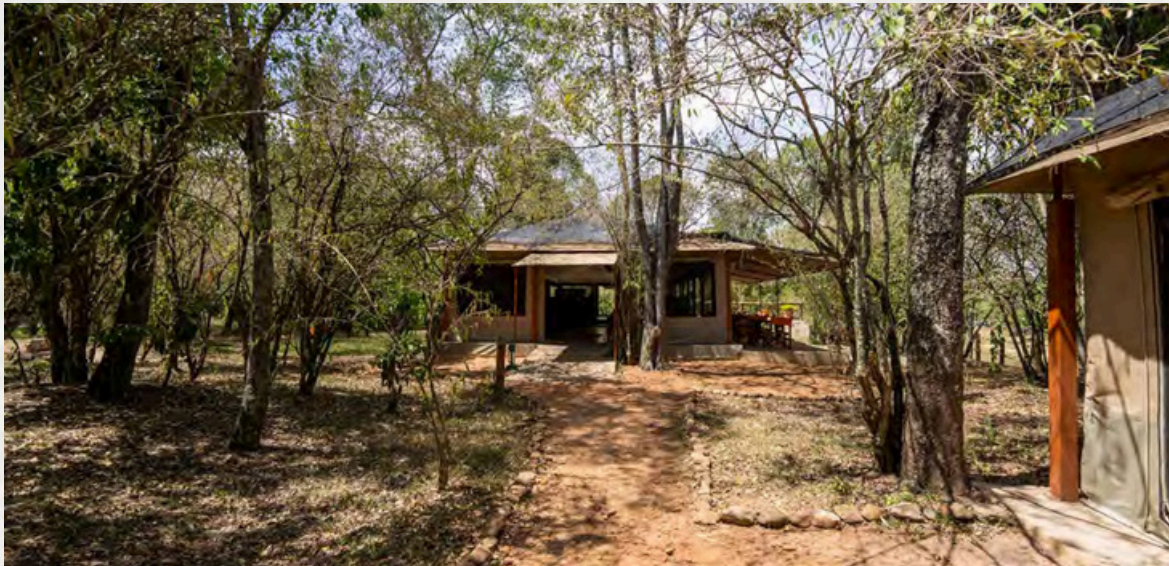
Links im Hintergrund der Parkplatz mit kurzem Zugang zum Lounge-Zelt.