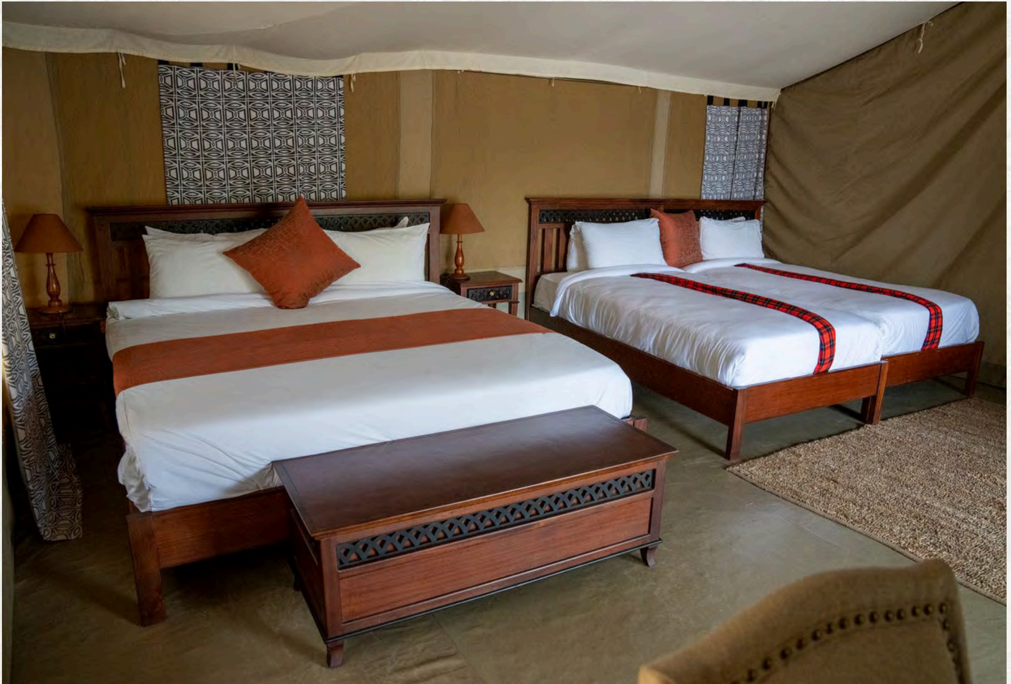
Der Schlafraum kann von bis zu 4 Personen genutzt werden.