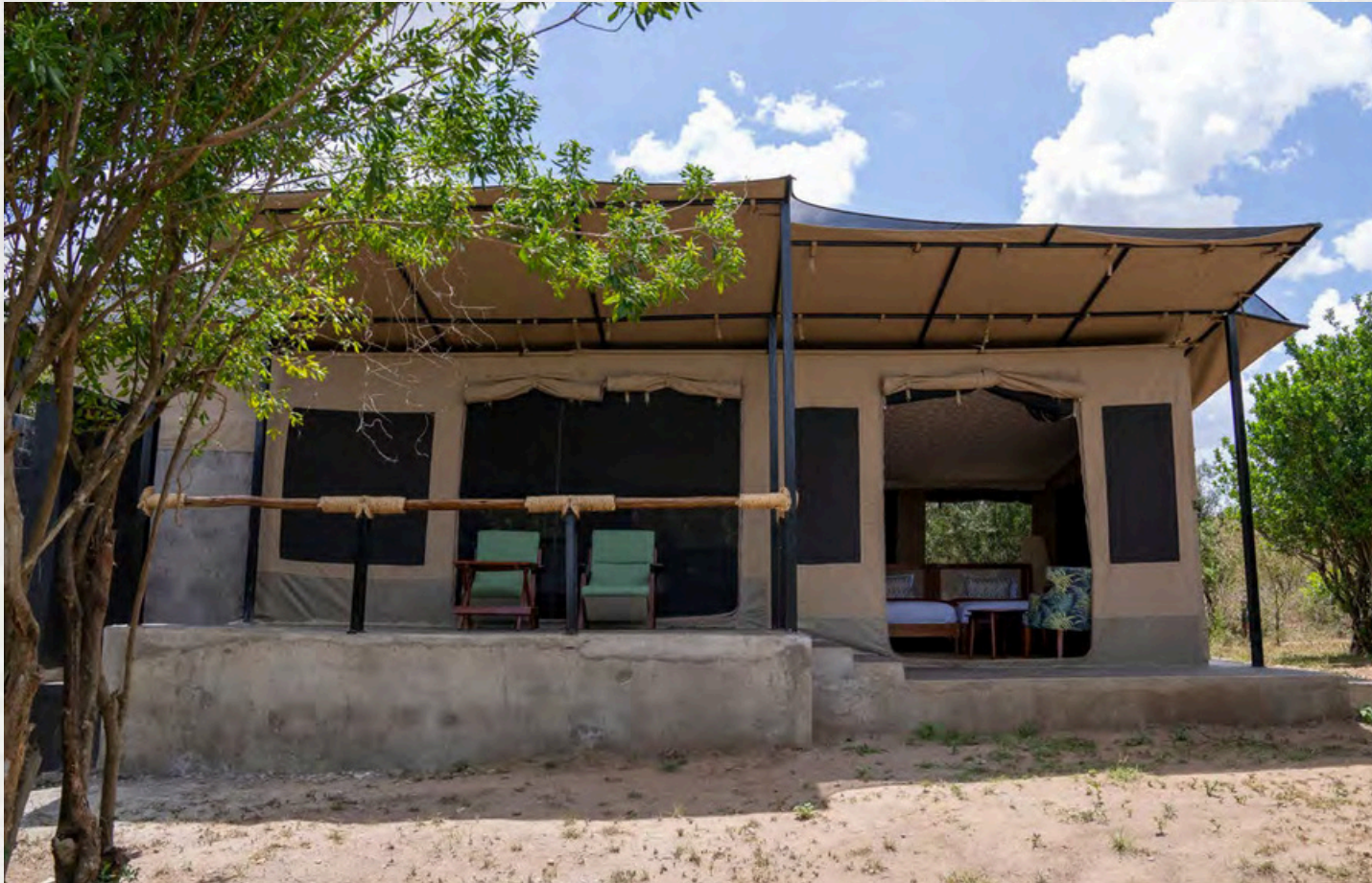
Chalet-Zelt mit großer Terrasse, Außendusche und Extra-Wohnraum.

Im Olive Bushcamp stehen zwei außergewöhnliche, sehr große und luxuriöse Chalet-Zelte zur Verfügung. Diese Zelte sind sehr hell und üppig ausgestattet und ideal für längere Aufenthalte. Sie verfügen über eine große Terrasse, einen anspruchsvoll möblierten Wohnraum, ein großes Schlafzimmer und ein luxuriöses Marmorbad. Die Zelte können im Vorraum wahlweise als Wohnzimmer oder zur Nutzung als Familienzelt mit Betten ausgestattet werden. Die Preise und Verfügbarkeit nur auf Anfrage.