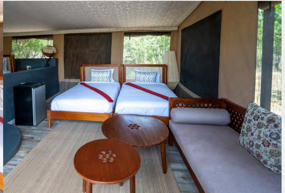
Vorraum mit Betten zur Nutzung als Familienzimmer