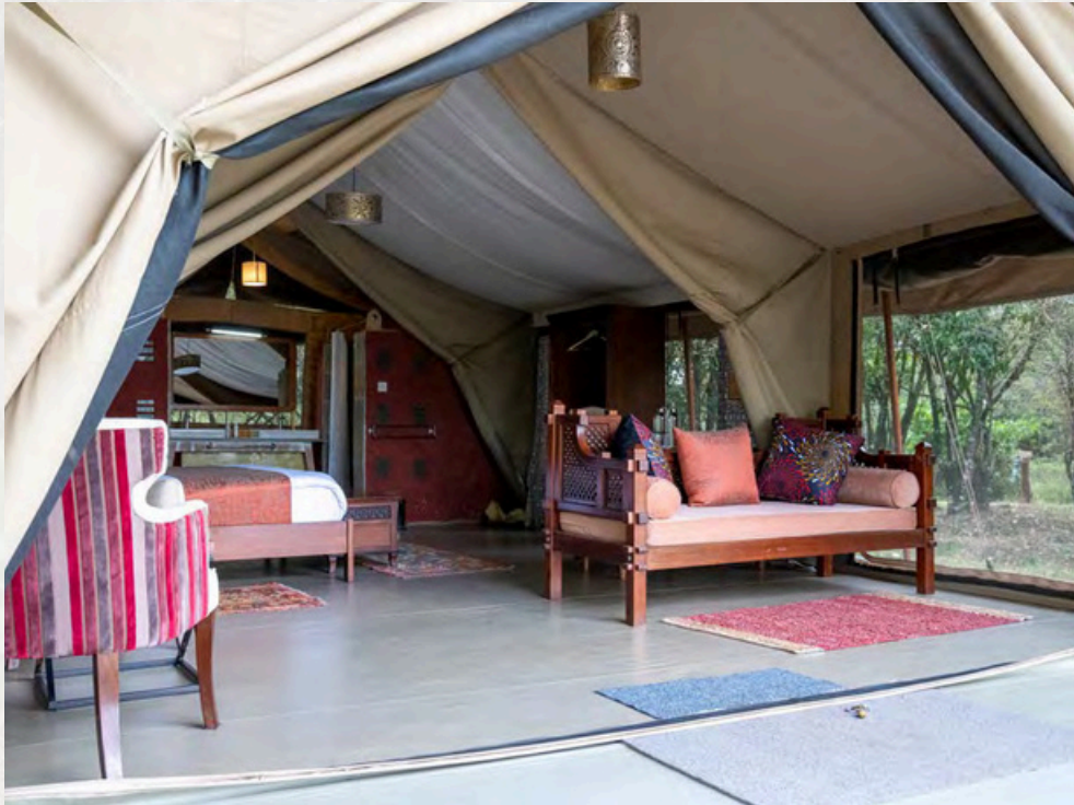
Die luxuriösen Doppel- und Twinbed-Zelte sind hell und großzügig geschnitten und sehr hochwertig eingerichtet.

Die Doppel- und Twinbett Zelte sind sehr großzügig geschnitten und unterscheiden sich nur in der Ausstattung mit einem großen Doppelbett oder zwei komfortablen Einzelbetten.