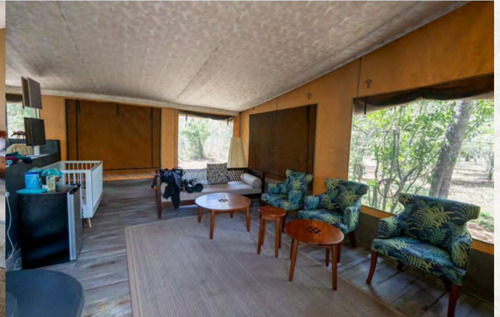
Vorraum als Wohnzimmer mit zusätzlichem Babybett