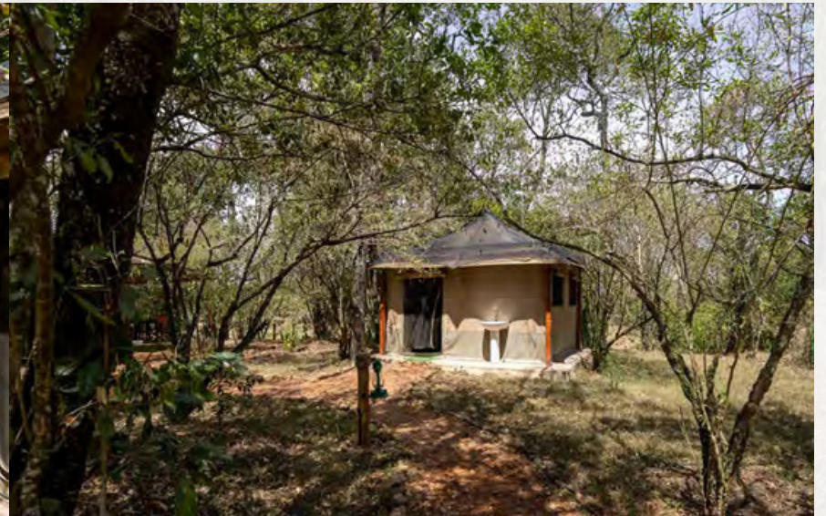
Die Waschräume am Lounge-Zelt.