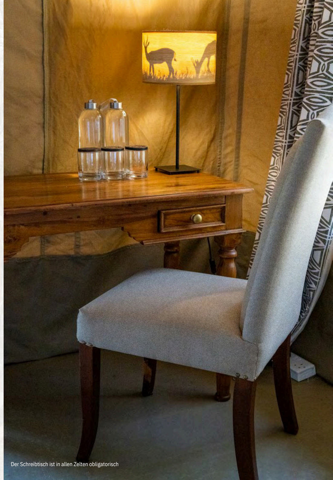
Der Schreibtisch ist in allen Zelten obligatorisch